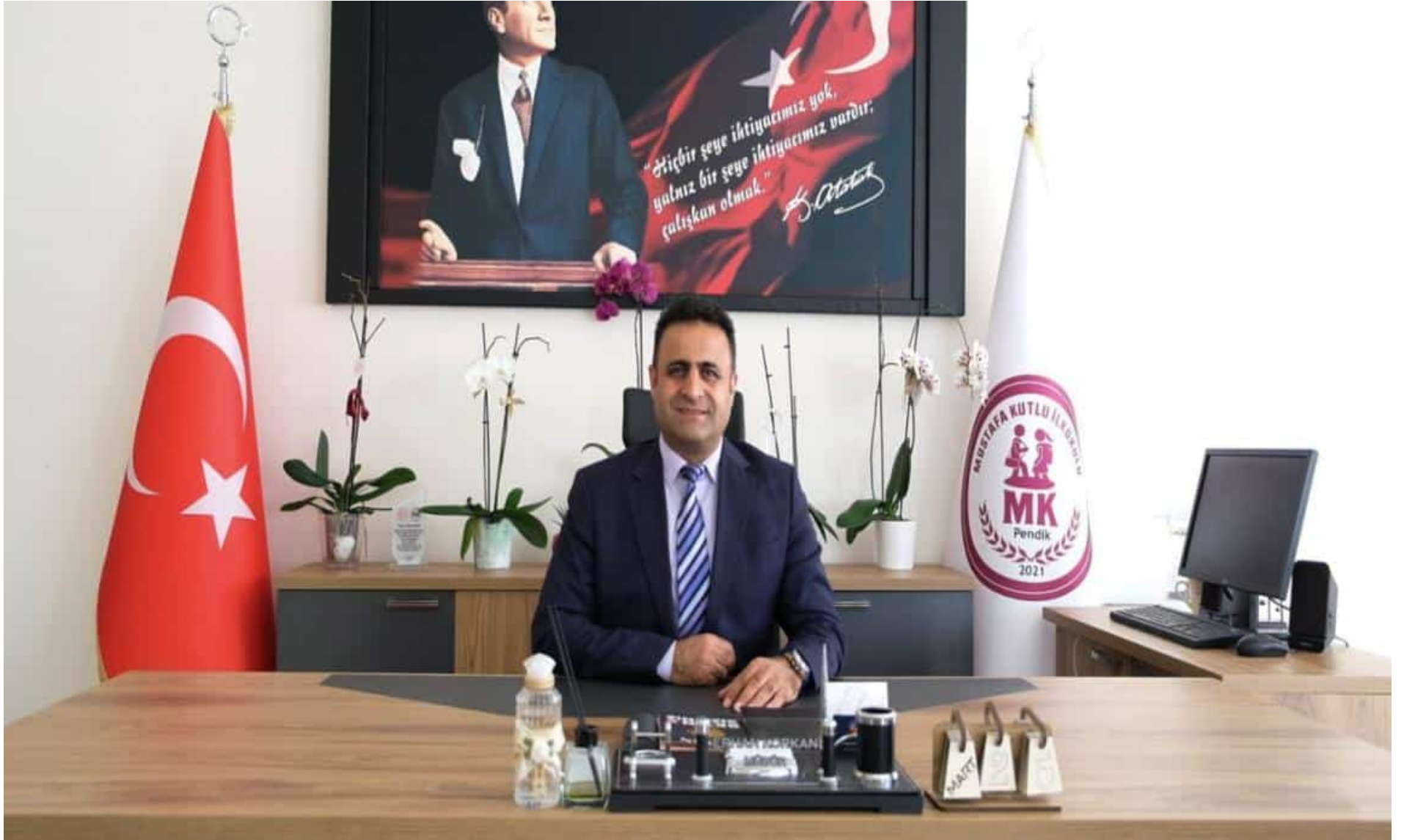
Stratejik plan sunuş;